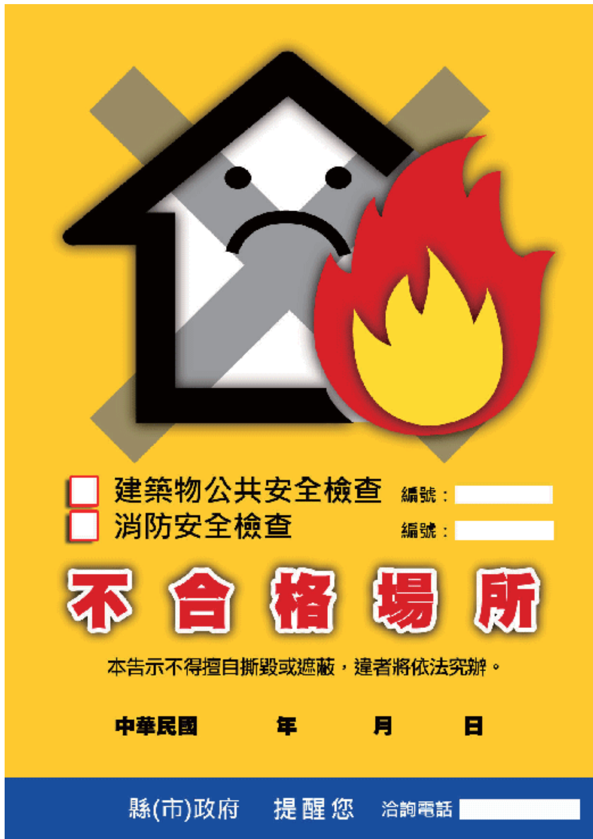
附圖 建築物公共安全檢查及消防安全檢查不合格張貼告示